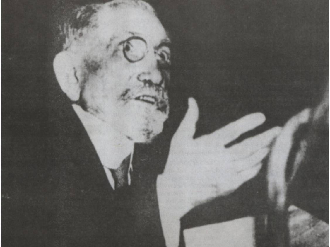
FIG. 1 – Charles Maurras pendant son procès. Il a 77 ans. Debout pendant sept heures, il va lire sa « défense » : une liasse de 132 feuillets.