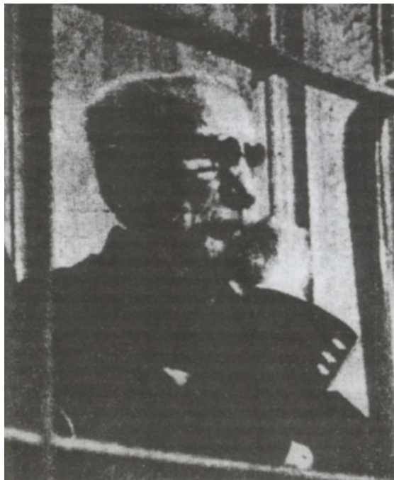
FIG. 2 – Charles Maurras suivant les dépositions des témoins.