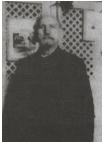
FIG. 5 – Charles Maurras dans sa cellule, vers 1948.