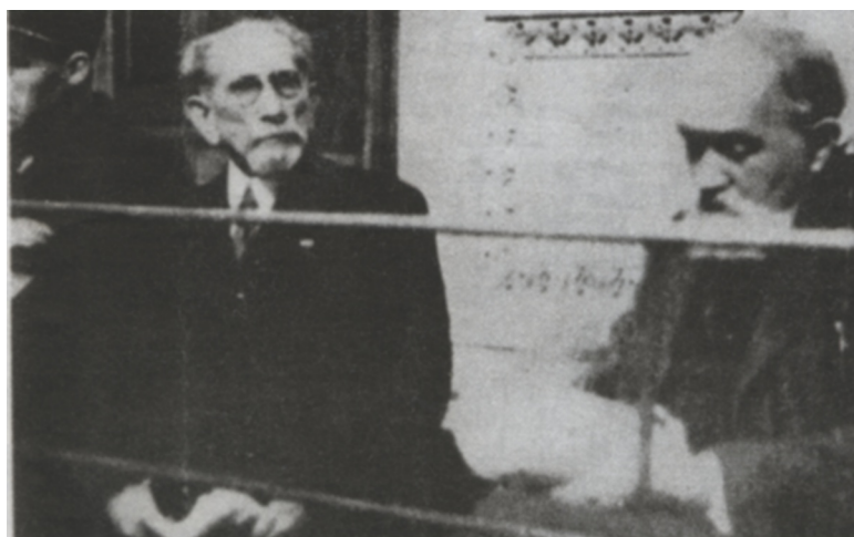
FIG. 4 – Charles Maurras et Maurice Pujo devant la Cour de Justice de Lyon.